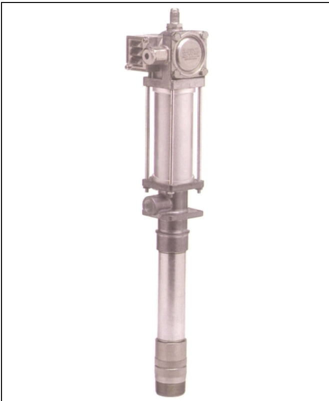
Pumpe Nr. 282396